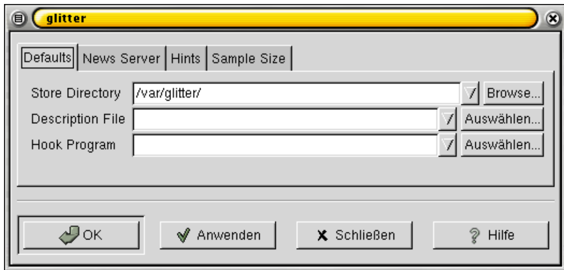
Das Einstellungsfenster bietet zahlreiche Möglichkeiten

Im Tab News Server gibt es die praktische Option, mehrere Verbindungen gleichzeitig aufzubauen. So kann man die ganze Bandbreite seiner Leitung ausnutzen und verbraucht weniger Online-Zeit.